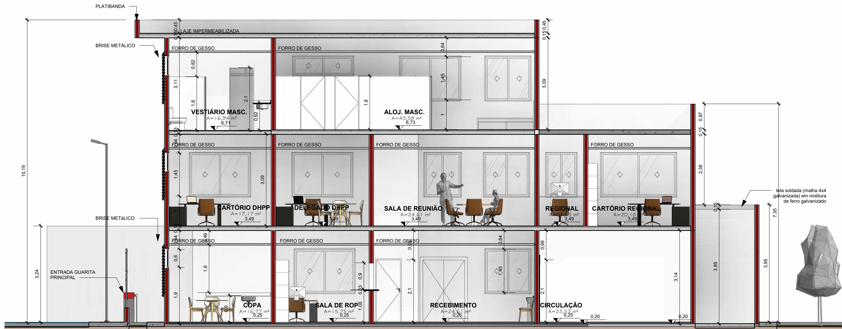
DELEGACIA - Corte 3 ESCALA 1 : 75