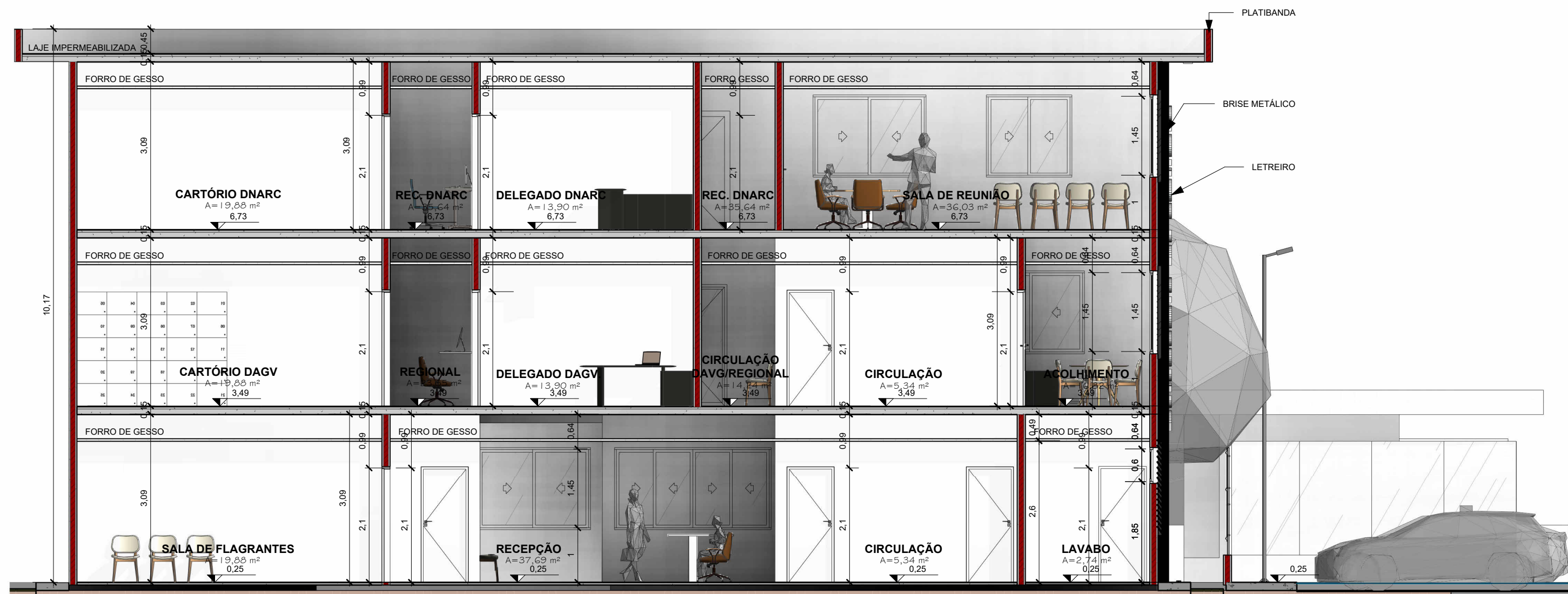
DELEGACIA - Corte 4 ESCALA 1 : 75